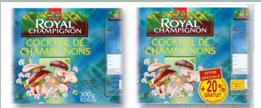
Esempi di confezioni prima e dopo la sovrastampa (Rotoprint Sovrastampa).